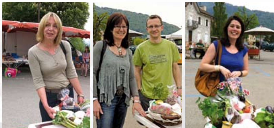
Les heureux gagnants du loto de Pâques

Rappelons aussi que le premier samedi de chaque mois, le marché s'agrandit en recevant les artisans locaux qui exposent leurs travaux.